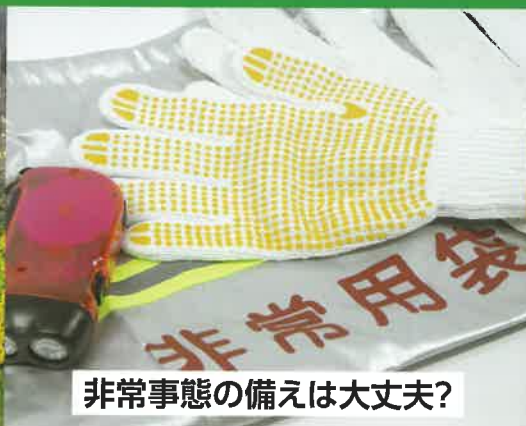
非常事態の備えは大丈夫?