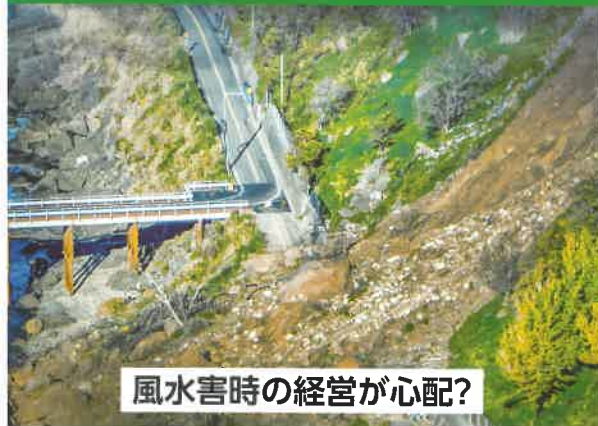
風水害時の経営が心配?