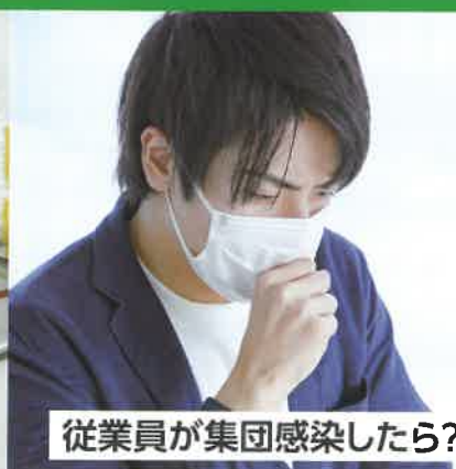
従業員が集団感染したら?