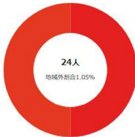
滞在人口/都道府県内ランキング 上位10件