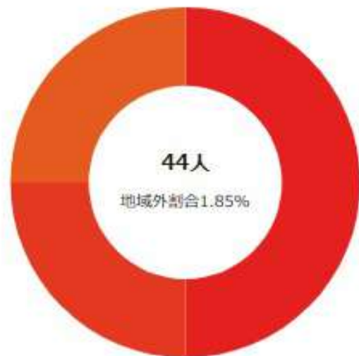
滞在人口/都道府県内ランキング 上位10件